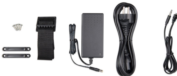
Correa de fijación Adaptador Cable de alimentación Pulsador con cable (2m) y LED bicolor