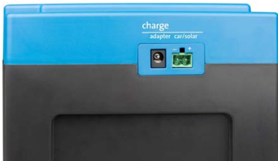
Adaptador y panel de entrada vehículo/solar (coche/solar) (toma para entrada de coche/solar suministrada)