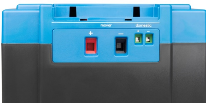
Salida de alta capacidad (mover) y salida de baja capacidad