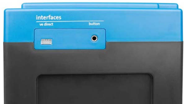
VE.Direct y pulsador